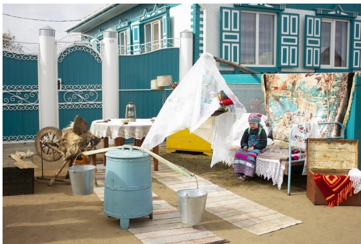
Паздник улицы «Бичурские дворики»