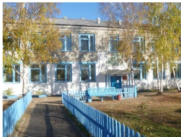
МБОУ «Бичурская СОШ № 3»

Село наше окружают высокие горы, а самая высокая называется Утёс. Поднимешься на эту гору и увидишь улицы нашего села – их около 50 – церкви, больницу, Дом культуры, библиотеку, школы. Их в селе 5. В одной из них работаю я. Это моя любимая школа № 3, которая находится по улице Коммунистической. В школе работают замечательные учителя, учатся хорошие ученики, но я хочу рассказать не об этом.