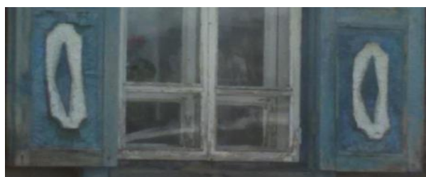
Символ вспаханного поля

Очень распространенным узором на оконных наличниках был женский символ «берегини» - стилизованное изображение женской фигуры. Несмотря на некоторое искажение, эту фигуру можно отгадать среди оконных узоров. Кроме вышеперечисленных символов на оконных наличниках присутствовали стилизованные изображения животных и птиц – лошади, волки, лебеди, петухи, голуби.