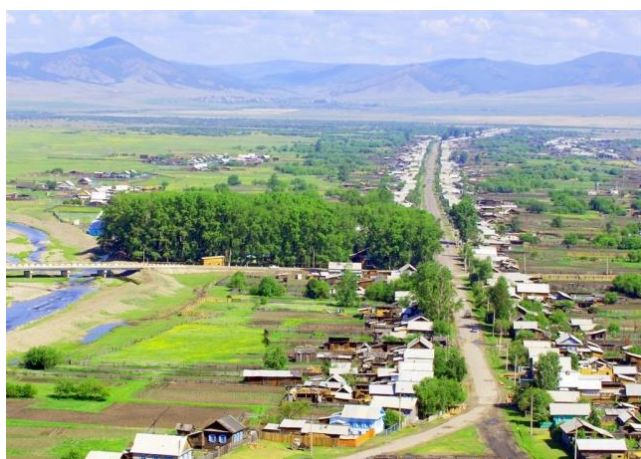
Современная Бичура

Бичура на сегодняшний день является крупным семейским селом в Забайкалье. Этноним «семейские» сформировался в начале XIX века, первоначально переселенных староверов именовали «поляки» или «польские выселенцы». Название это, очевидно, связано с тем, что старообрядцы пришли в Забайкалье семьями, и, в отличие от первых поселенцев, жили семьями, разводились редко, в браке были счастливы и рожали много детей.