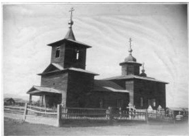
с. Бичура, Церковь Успения Пресвятой Богородицы, год постройки – 1848г.

Староверы – это люди, отказавшиеся принять церковные реформы патриарха Никона и придерживающиеся церковных установлений Древней Руси. Они стараются сохранять все догматы, канонические положения, чины древнерусской церкви.