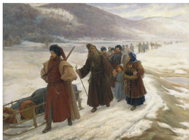
Милорадович С.Д. «Путешествие Аввакума по Сибири», 1898г.

середине XVIII века. Семейские являются старообрядцами, которых правительство Российской империи выслало в XVIII веке в Забайкалье при разделе Речи Посполитой (Польши) между Российской империей, Пруссией, Австрией и Венгрией.