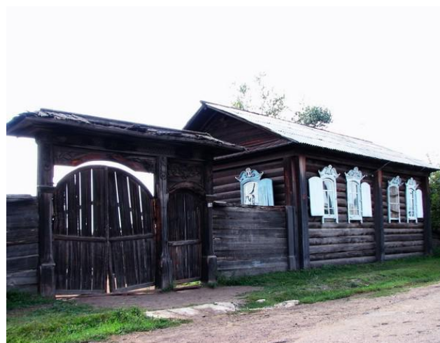
Дом старообрядцев

Народный земледельческий календарь представляет собой сложные комплексы дохристианских аграрно-магических представлений и христианских воззрений. Человеку, в первую очередь, надо было заботиться об урожае, о здоровье своей семьи и скота, о передаче опыта подрастающему поколению.