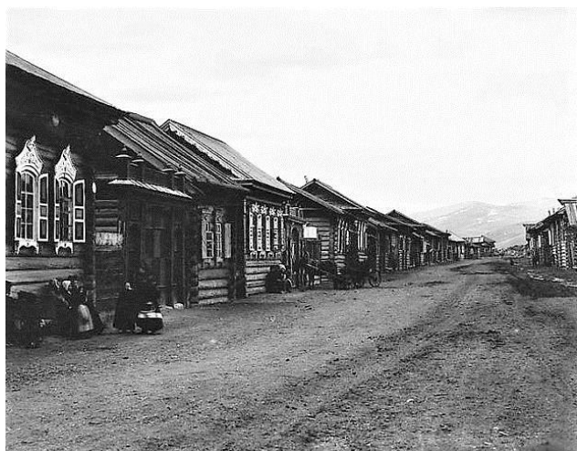
Улица Бичуры XIX века

Старообрядцы смогли не только быстро освоиться на чужих землях, построить дома и завести хозяйство, но